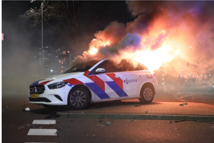
Bij de rellen in Den Haag gingen meerdere politieauto's in vlammen op.

De gemeente Den Haag zegt dat zij wel degelijk met alle kanten van de Eritrese gemeenschap heeft gesproken. Bovendien, aldus de woordvoerder, 'iedereen mag een evenement organiseren. De politie had de bedreigende uitlatingen van tegenstanders op sociale media gezien en heeft een risico-inschatting gemaakt.'