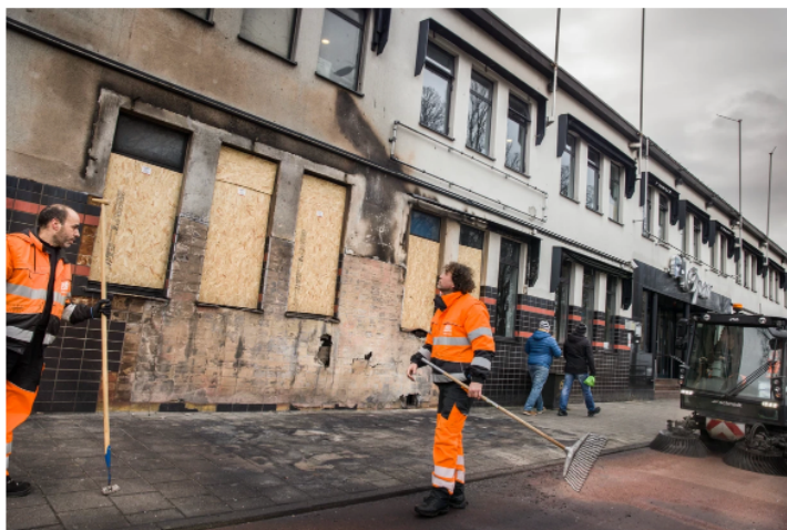
De vernielingen aan het zalencentrum Opera in Den Haag zijn na de rellen duidelijk te zien.

De gemeente laat nu onderzoeken of de Brigade Nhamedu achter de actie zit. Dat is een internationale organisatie die, voornamelijk via sociale media, gevluchte Eritreeërs wereldwijd oproept zich te verzetten tegen bijeenkomsten die zij associëren met het regime dat zij zijn ontvlucht.